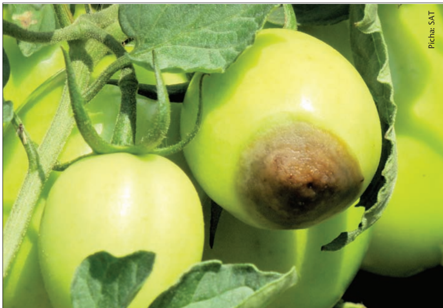
Nazi zilizovunwa zisijazwe sana kwenye vyombo vya usafiri kuepuka kudondoka

Yafuatayo ni baadhi ya mambo ambayo yanaweza kufanyika ili kuthibiti tatizo