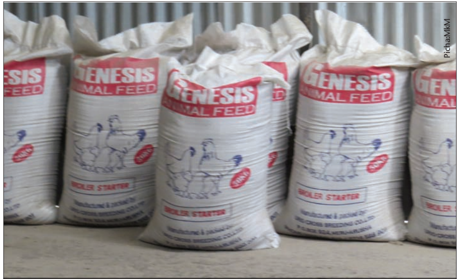
Hakikisha unatunza chakula cha kuku kwenye sehemu safi isiyokuwa na unyevu

Kuku wanapenda kula wadudu lakini siyo wadudu wote ni safi kwa kuku. Wadudu kama nodno na mende wanapenda kula chakula cha kuku na kuishi humo.