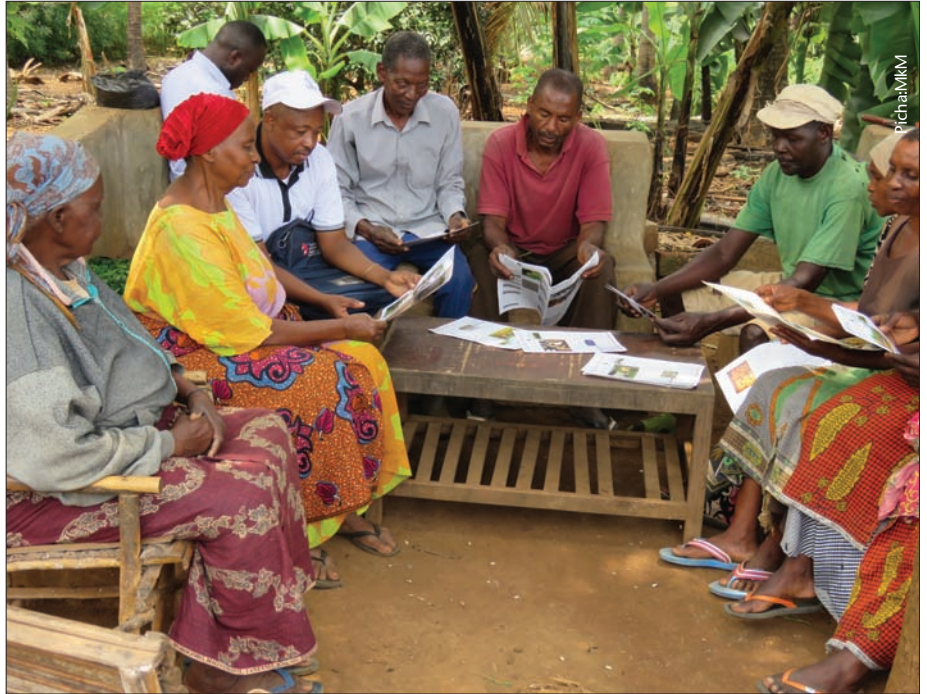
Wanachama wa kikundi cha Upendo wakijadili mambo kadha wa kadha kutoka kwenye jarida la MkM