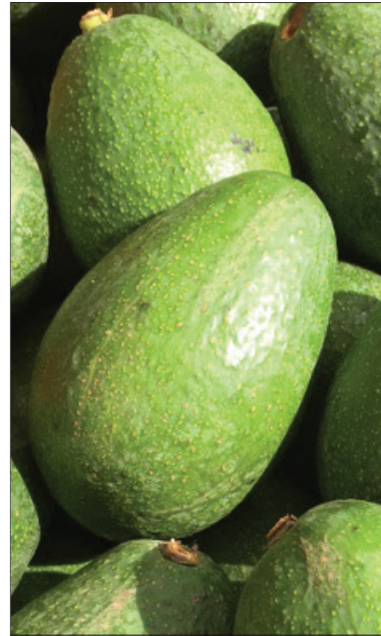
Ubebishaji uliofuata kanuni sahihi hup

maeneo ya mwinuko na hata katika maeneo ya tambarare. Aina hizi zinaweza kupandikizwa katika aina nyingine zozote za miparachichi ili kuongeza ubora wa matunda.