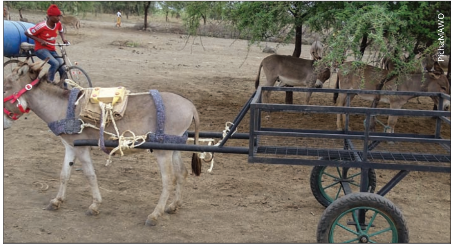
Punda anapovuta mzigo uliopo kwenye mkokoteni humpunguzia uzito

Ikiwa mzigo utaelelea nyuma zaidi utasababisha miguu kushindwa kukanyaga chini na wakati mwingine punda kunyanyuliwa juu. Jambo hili ni hatari na humuumiza punda.