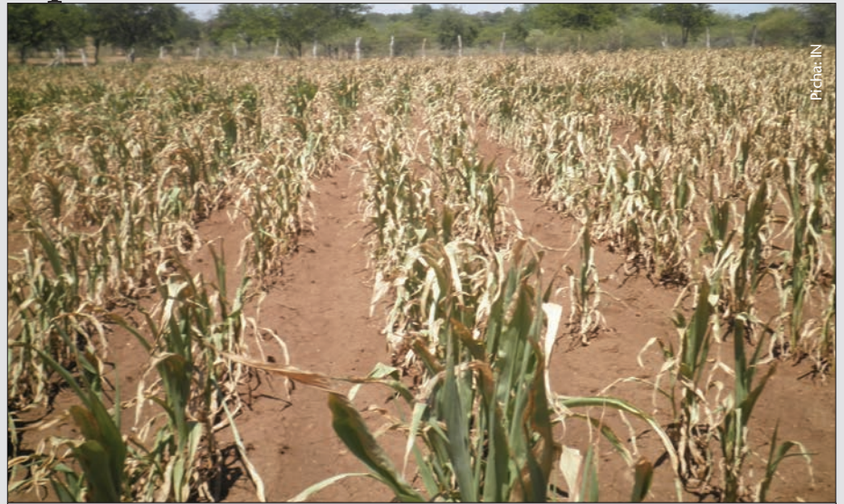
Mara nyingine hasara kwenye kilimo hutokana na hali ya hewa

Kuna jambo la maana sana ambalo hatuliangalii na hatujajiuliza maswali yafuatayo: Je hawa Watanzania ambao wanaachana na kilimo wanakwenda wapi na wanafanya nini. Je hali zao kiuchumi zikoje? Wana hali nzuri zaidi