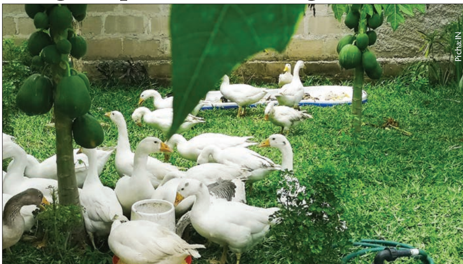
Ni muhimu bata kupata eneo la wazi kujilisha