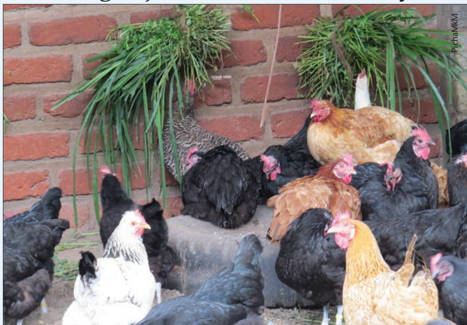
Zingatia chanjo ili kuku wako wawe salama wakati wote

chanjo (batch number) kisha wape vifaranga dawa ya kuzuia ugonjwa wa kuharisha damu (coccidiosis) kwa muda wa siku 3 mfululizo mara wafikishapo umri wa siku 7.