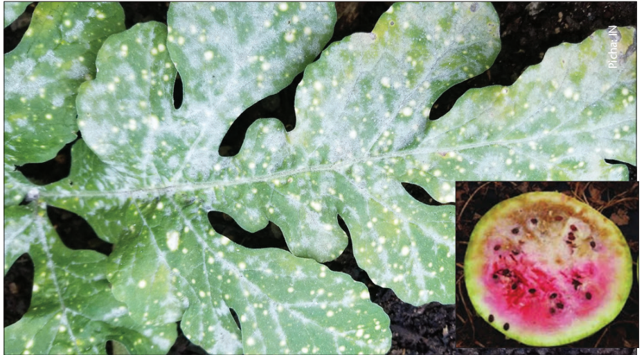
Hakikisha unafuata kanuni sahihi ili kuepuka wadudu na magonjwa shambani mwako

Ili kujua dawa za magonjwa ni vizuri kuchukua sampuli na kwenda nayo kwenye duka la dawa na pembejeo