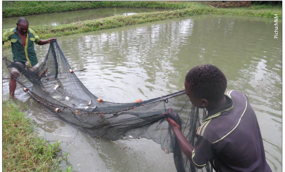
Ni muhimu kukagua bwawa mara kwa mara ili kufahamu maendeleo ya samaki

biashara au wahali ya kawaida tu. Maamuzi haya yataathiri mtazamo na jitihada za mfugaji katika kuliendesha bwawa lake hususani katika suala zima la chakula.