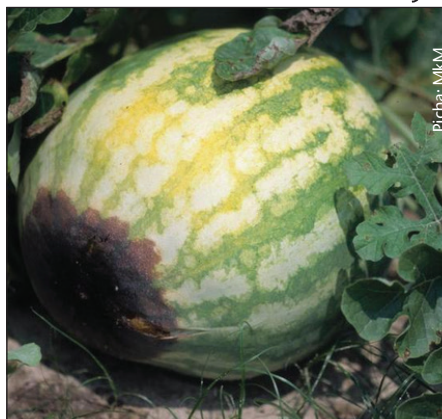
Zingatia uchaguzi wa mbegu na matunzo ya shamba ili uhepuke hasara