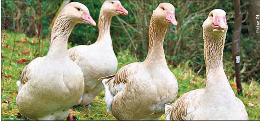
Bata ni mmoja wapo ya ndege wafugwao wenye tija kubwa kwa mfugaji

Mara nyingi wafugaji wamekuwa wakitumia njia mbalimbali ikiwa ni pamoja na kuongeza mifugo, na kupanua shughuli za ufugaji ili kujiongezea pato.