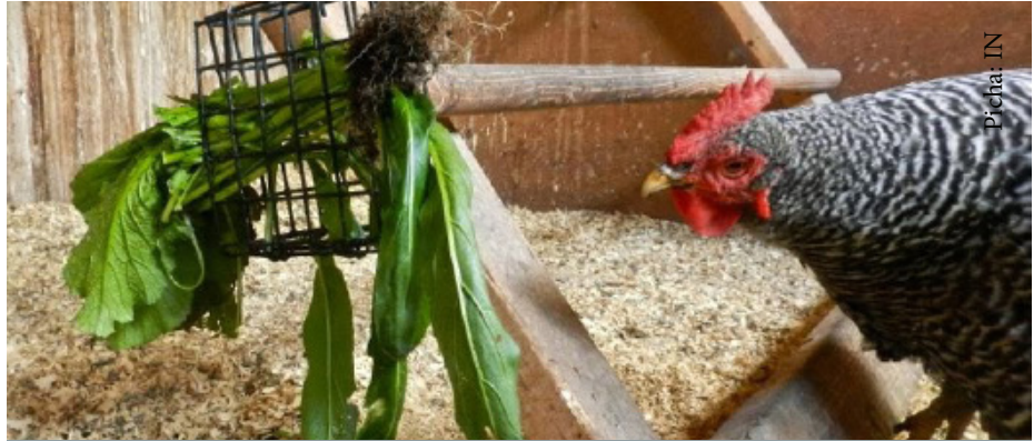
Zingatia chakula bora unapolisha kuku