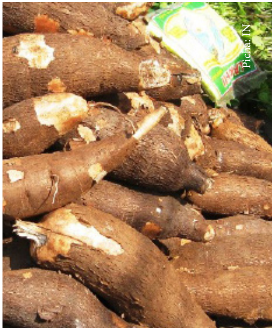
esafisha kuondoa udongo kuepusha kuoza