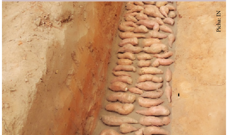
Viazi vitamu vilivyoandaliwa kwa uhifadhi wa kutumia shimo

Hakikisha wakati wa uhifadhi, unaweka mazao haya katika eneo ambalo haliruhusu maji au unyevu utakaopotelekea mazao kupata ukungu.