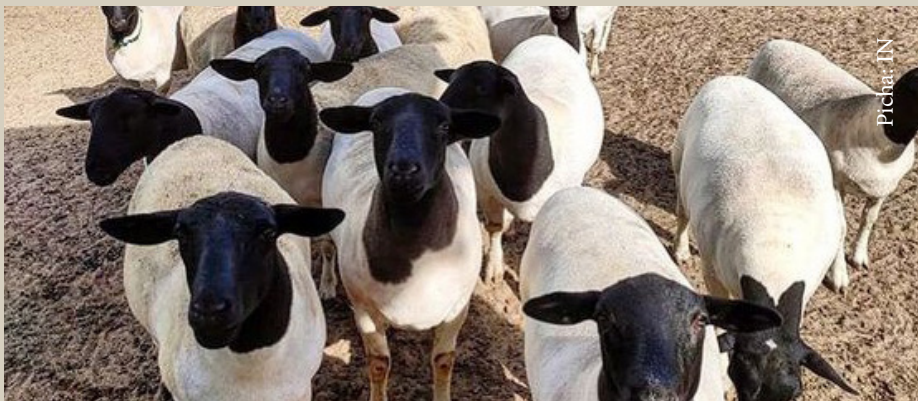
Kondoo chotara waliotokana na mchanganyiko wa aina mbili za koo

Njia ya haraka zaidi ya kuboresha kundi lako ni kuzalisha kondoo chotara. Inashauriwa utumie kondoo wa kienyeji kama wanyama wa kuanzia mpango wa kuzalisha kondo bora zaidi.