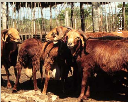
Kondoo aina ya red masai

Chagua kondoo jike walio na maumbile mazuri, mwili mrefu na mifupa yenye nguvu. Kwa njia hii unapata kon-