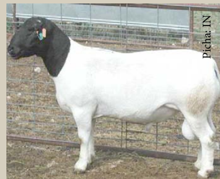
Kondoo aina ya Dorper ram

Kondoo wa kienyeji (kama kondoo wa Kimasai ) hupandishwa kondoo dume wa Dorper . Kondoo wa kike wanaozaliwa pia wanapandishwa tena dume wa Dorper wasiohusiana. Kwa kufanya hivi, unachanganya sifa nzuri za kondoo wa kienyeji na kondoo wa kigeni. Unazalisha angalau mara mbili ili kupata kizazi kizuri chotara.