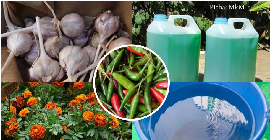
Tumia malighafi za asili kutengeneza dawa salama kwa mazao shambani

Kama ilivyo ada wakulima wa kilimo hai, huitaji malighafi asili ili kuzalisha mazao salama na yenye ubora shambani.