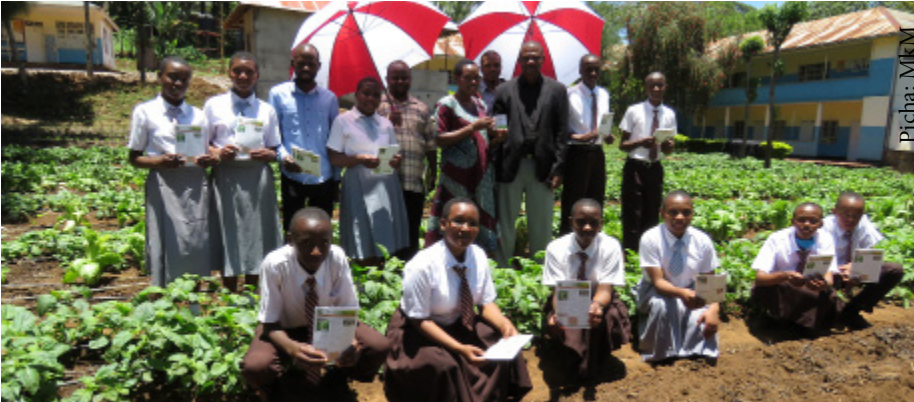
Wanafunzi wa Makomu sekondari wakiwa katika shamba lao la kilimo hai