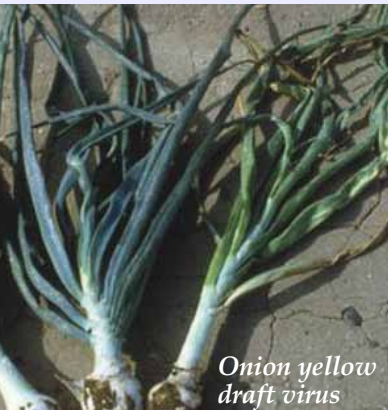
Onion yellow draft virus

Kwa maelezo zaidi wasiliana na Bwana Suleiman Mpingama mkufunzi na mtaalamu wa mazao kutoka chuo cha kilimo Tengeru. Unaweza kutumia namba +255 756 428 877