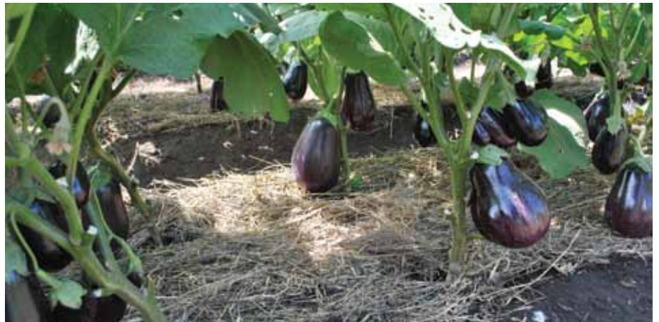
Shamba la bilinganya linafaa kuwa safi wakati wote ili kuepuka wadudu waharibifu.

Ni muhimu kwa mkulima kuwa na trei maalumu kwa ajili ya kusia mbegu