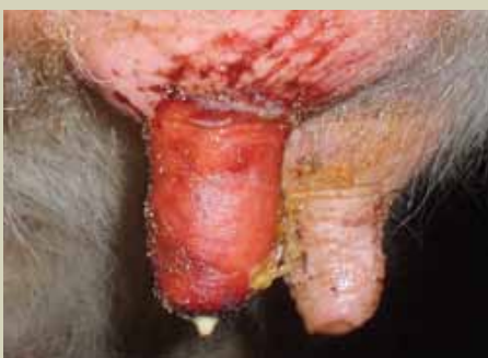
Titi la ng'ombe aliyeathiriwa na mastitis huvimba na kuonekana kama aliyejeruhiwa.

Mastitis ni ugonjwa wa kuvimba ziwa unaosababishwa na bakteria hususani jamii ya streptococci na staphylococci ambao wanapatikana zaidi