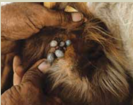
Kupe hupendelea sehemu zilizojificha kwenye mwili wa mnyama.

Tumbaku: Chukua kilo moja ya majani mabichi ya tumbaku, tumbukiza katika maji lita 10 kisha iache kwa muda wa dakika tatu. Tumia kitambaa safi kumpaka ng'ombe. Lita 5 zinatoshwa kwa ng'ombe mmoja. ■