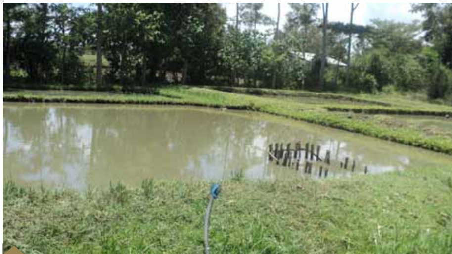
Ni muhimu kuzingatia utunzaji wa bwawa na kuhakikisha ni safi wakati wote. Samaki wanapotunzwa vizuri huzaliana kwa haraka na kuongeza pato la mfugaji.